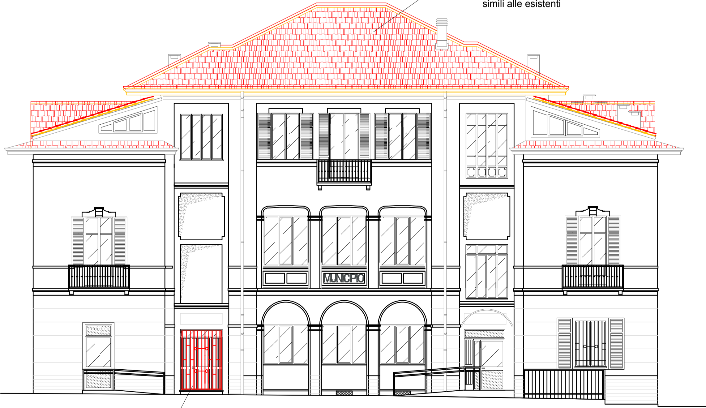
Prospetto su piazza Roma - scala 1: 100 Stato comparativo