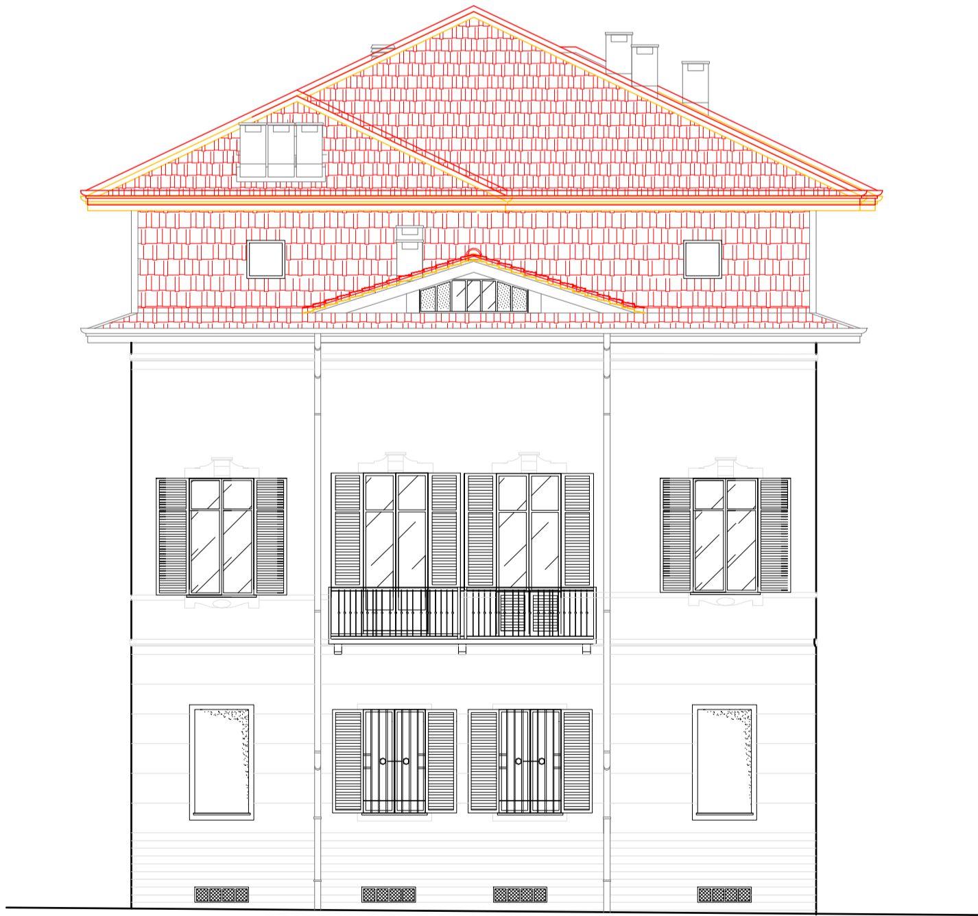
Prospetto su via Detomati - scala 1: 100 Stato comparativo