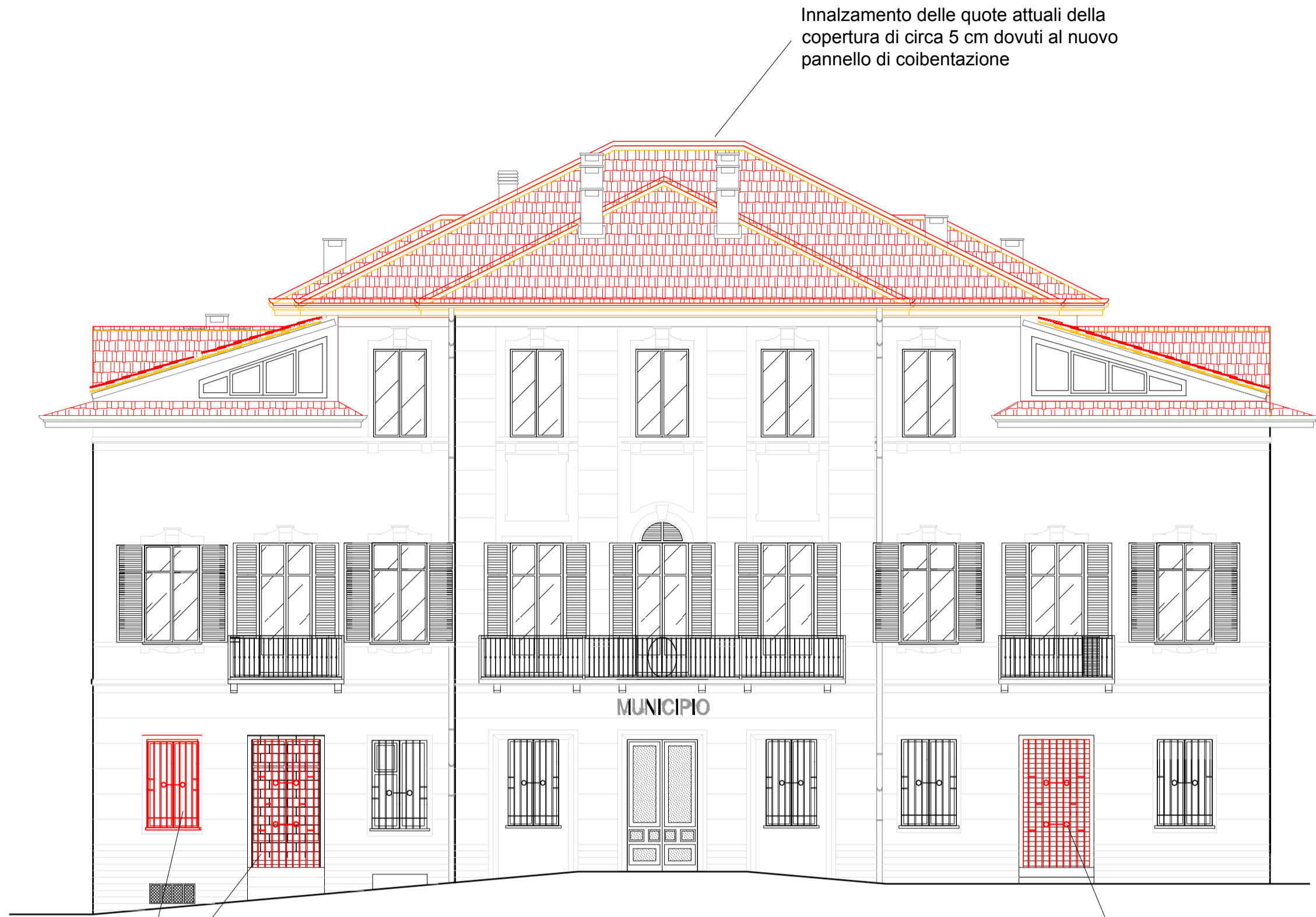
Prospetto su via Milano - scala 1: 100 Stato comparativo