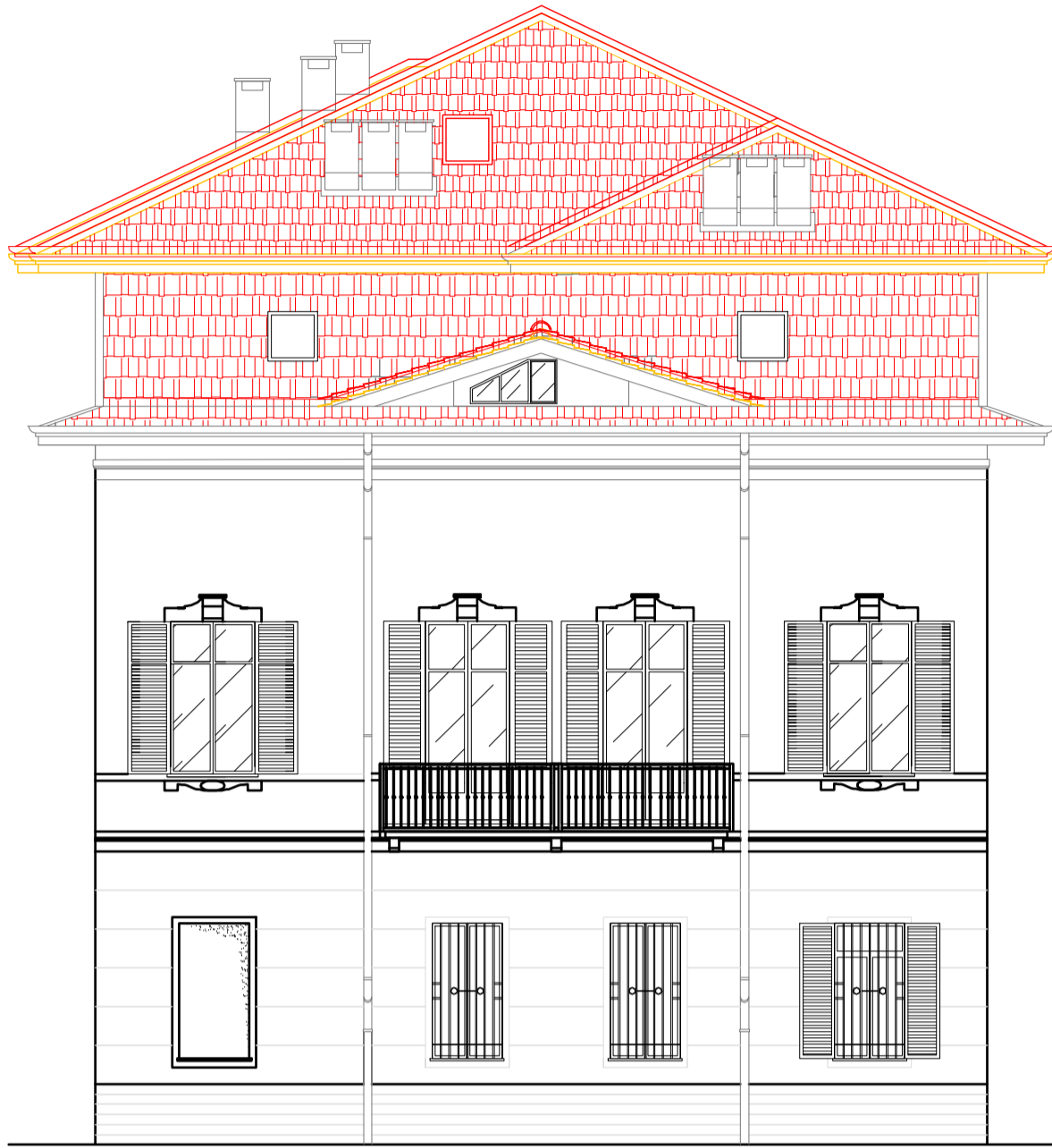
Prospetto su via Marconi - scala 1: 100 Stato comparativo