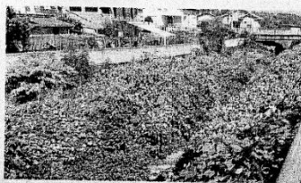
FOLTA Vegetazione abbondante sulle sponde del Chiebbia

Folta ma fragile. «L'essenza che così vistosamente è cresciuta si chiama Reynoutria japonica - spiega la