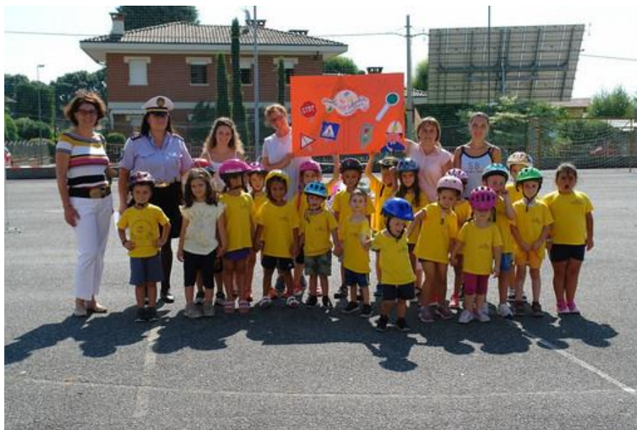
I piccoli patentati

Il 16 e 17 luglio la polizia locale di Vigliano Biellese ha incontrato 22 piccolissimi per parlare di educazione stradale