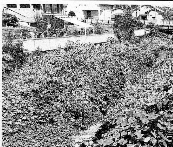
Il torrente Chiebbia invaso dalle piante infestanti, molti chiedono al Comune di intervenire