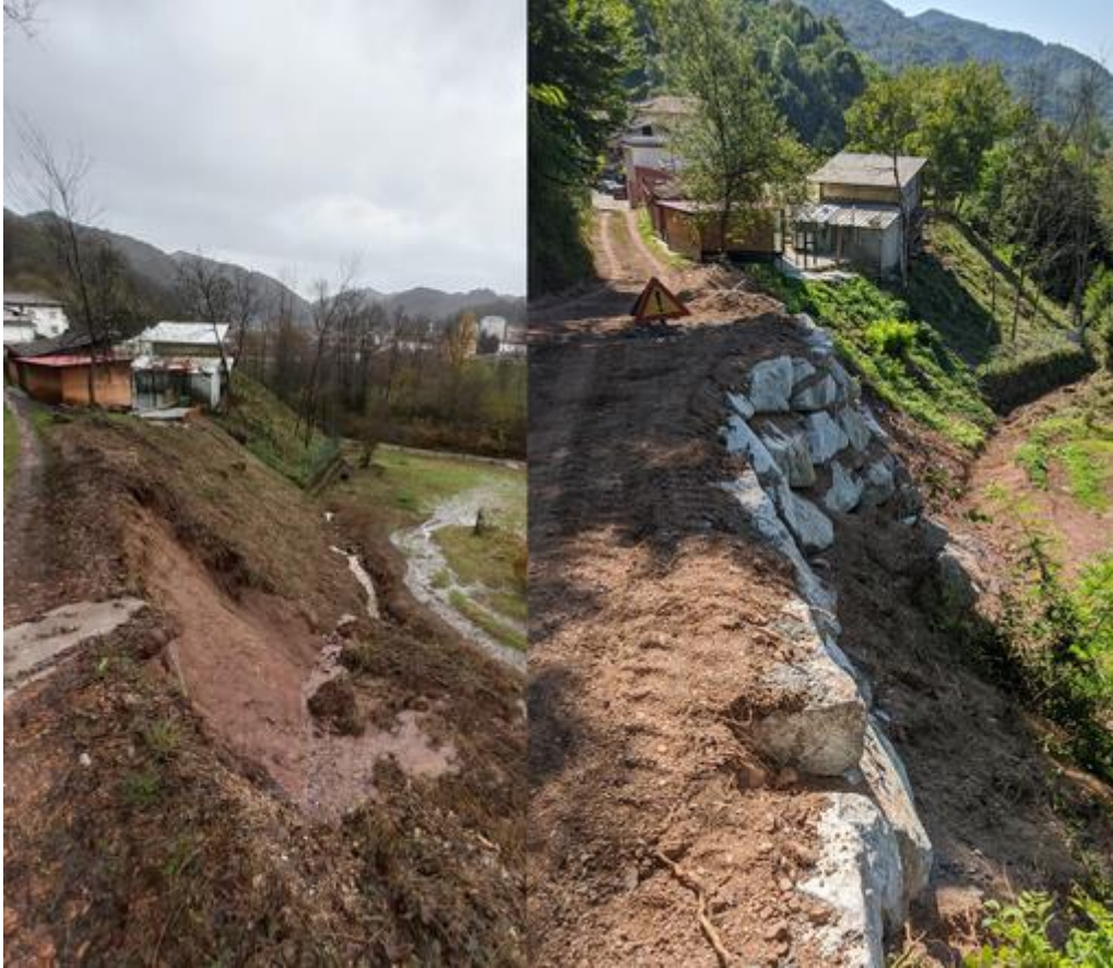
Prima e dopo i lavori