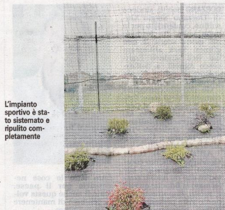
L'impianto sportivo è stato sistemato e ripulito completamente

A suggellare l'importante taglio del nastro saranno presenti anche i rappresentanti della federazione calcio e naturalmente i ragazzi».