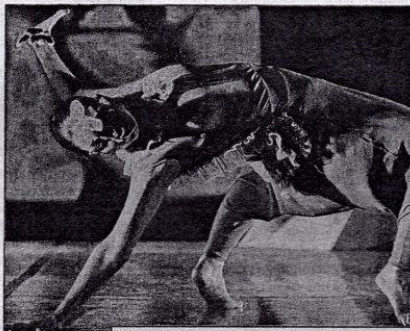
Immagini di scena. Sopra una coreografia da "Gazela, la zia Akima e lo spirito della Sagghezza" portato sul palco da Movimentionactor.

A fianco una coreografia da "Pietà per Icaro" della Compagnia Francesca Selva