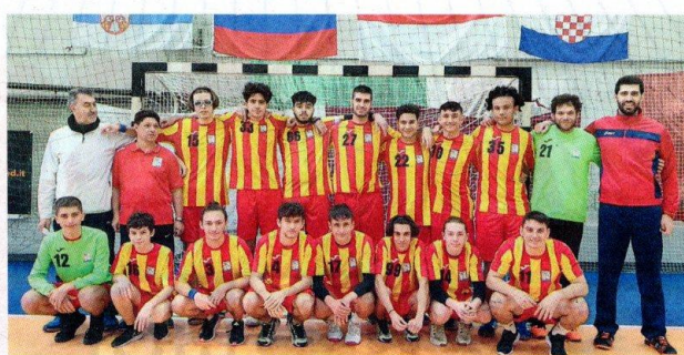
La società della pallamano di Vigliano al completo. Domenica scorsa la squadra ha debuttato in serie B