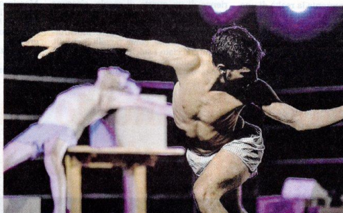
Ritorna al teatro Erios la fondazione Egri

Un'importante opportunità, dedicata al territorio biellese che permette al pubblico di conoscere e vedere i differenti sviluppi poetici ed estetici dei partner della Compagnia nel tempo e soprattutto alla Compagnia di stringere e approfondire rapporti artistici che non possono che arricchire reciprocamente oltre a permettere nel medio/lungo termine progettualità condivise, frutto di una frequentazione e una conoscenza approfondita da cui affiorano affinità, vocazioni e punti di incontro. Due gli appuntamenti in programma al Teatro Erios: Gazela, la zia Akima e lo spirito della Saggezza della Compagnia MovimentoInactor