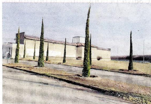
I cipressi piantati lungo il viale del cimitero di Vigliano Biellese

VIGLIANO BIELLESE (pom) Novità lungo il viale d'accesso al cimitero di Vigliano Biellese.