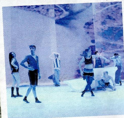
Due fotografie che ritraggono gli artisti di Egridanza durante le loro esibizioni