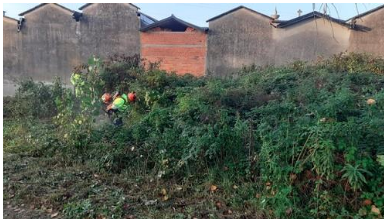
Puliti i rio Ottina e Bazzella, bel lavoro dei volontari della Protezione Civile di Vigliano Biellese FOTO

Nelle giornate tra il 25 ottobre e il 5 novembre, i volontari della Protezione Civile di Vigliano Biellese hanno svolto la completa pulizia del Rio Ottina e del Rio Bazzella. “Un grazie di cuore da parte del direttivo a tutti i volontari che si sono impegnati nei lavori” spiegano dalla Protezione Civile in una nota stampa.