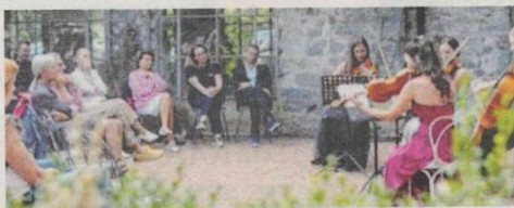
L'EVENTO di giovedì sera è stato un successo.

nebbiolo e nepolino, con Aral Cader che è il nebbiolo in purezza che fa anche botte di rovere francese, il nostro vino più importante». La serata è stata anche occasione per presentare l'annata 2020: «Siamo molto orgogliosi dei nostri vini - racconta ancora Tomaso - vengono prodotti interamente a Vigliano Biellese. Qui il vino si produceva sin dal 1800: a quei tempi veniva utilizzato come merce di scambio con la gente che lavorava vicino al castello. Poi con il tempo le vigne sono un po' andate sparendo, il nostro obiettivo è quello di riportare il vino e la vigna di Vigliano, che rientra già nel circuito delle città del