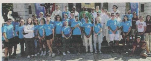
SUCCESSIONE A Vigliano Biellese per la festa dell'Assunta

gati alle feste locali. Servono a rinsaldare i legami e a rendersi conto dei doni che abbiamo. Nel cuore nasce un senso di riconoscenza la Signore che rende così viva la nostra comunità, viva e piena di giovani. Non siamo una comunità perfetta, ma una comunità che ha ancora l'orecchio attento agli sti-