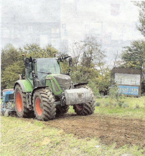
Si lavora alla costruzione delle oasi fiorite per la salvaguardia delle api

Nel Biellese in questi mesi di primavera nasceranno 6 nuovi oasi fiorite ricche di essenze mellifere, habitat ideali per le api e per gli altri insetti impollinatori il cui ruolo è fondamentale per l'ambiente e per l'ecosistema. Sono infatti 6 i Comuni che hanno aderito al progetto «+Api. Oasi fiorite per la biodiversità» che fa parte delle iniziative promosse a livello nazionale dall'associazione Filiera Futura, di cui la Fondazione Cassa di risparmio di Biella è socio fondatore, che dal 2020 lavora per innovare il settore agroalimentare con progetti condivisi. La Fondazione Crb, che aveva già affrontato il tema della salvaguardia delle api con progetti didattici per le scuole e un'oasi a Palazzo Gromo Losa, sostiene le prime adesioni con un contributo di