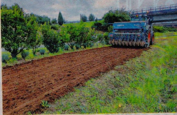
La Fondazione Crb ha finanziato sei progetti per la realizzazione nel Biellese di altrettante Oasi fiorite per lo sviluppo delle colonie di api

«Contribuire alla salvaguardia e implementazione delle colonie di api nel Biellese è un'azione