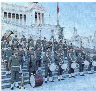
La fanfara Tridentina Walter Smussi ospite domenica a Vigliano

gurazione della sede avvenne in realtà l'11 settembre del 1983 - dice Giacoi -, ma per i festeggiamenti ci siamo adeguati alla data in cui la fanfara era disponibile. Siamo felici di ospitare 29 dei suoi elementi che domani visiteranno Oropa e il Museo degli Alpini presso la sezione Ana di Biella e la sera dormiranno nella palestra delle scuole medie messa a disposizione dal Comune di Vigliano; sarà una prova gene-