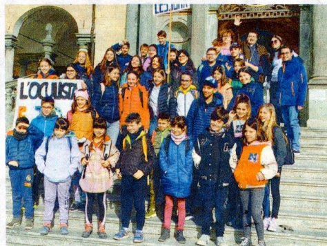
I BAMBINI DELLA PARROCCHIA DI LESSONA