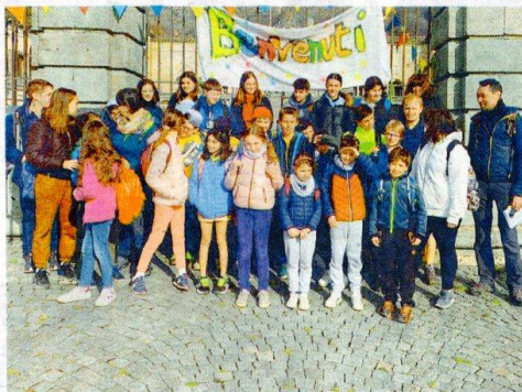
SANTO STEFANO BIELLA