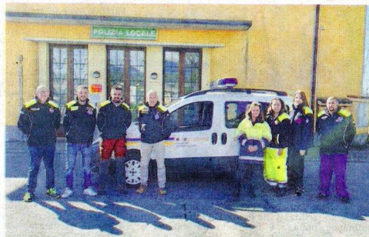
Nella fotografia a sinistra un gruppo di volontari della Protezione civile di Vigliano Biellese, a fianco la consegna del nuovo mezzo

Ad annunciarlo con soddisfazione è stato il direttivo. Lo ha fatto tramite una nota agli organi di stampa locali: "Nelle ultime settimane - si legge nel documento -, la nostra associazione è riuscita ad ampliare il proprio parco auto con un nuovo mezzo di emergenza. Un ringraziamento a tutti i volontari della nostra associazione che, grazie alla loro disponibilità nel svolgere i servizi, anche quelli più ardui come l'emergenza in Ucraina, hanno reso possibile l'acquisto del mezzo; e grazie a chi si è dedicato all'allestimento e a tutte le operazioni di pulizia e preparazione». Il gruppo di Pro-