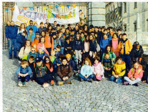
ORATORIO SANTA MARIA ASSUNTA VIGLIANO BIELLESE