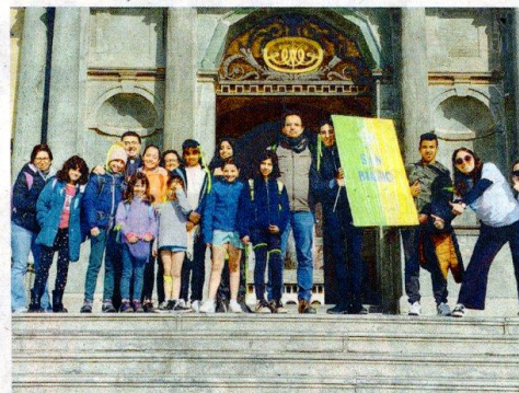
ORATORIO SAN BIAGIO BIELLA