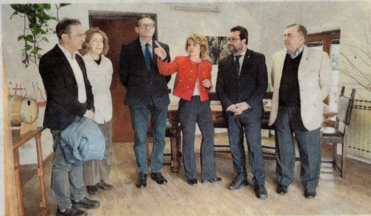
L'inaugurazione della sede dell'associazione nazionale Città del Vino a Vigliano