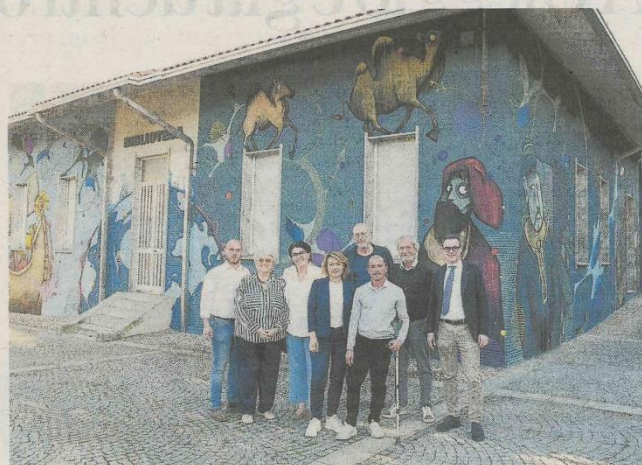
L'inaugurazione del nuovo murale sulle pareti esterne della Biblioteca di Vigliano