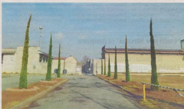
DUE FOTOGRAFIE CHE RITRAGGONO IL CIMITERO DI VIGLIANO

Il costo totale dell'opera è di circa 25mila euro, interamente a carico dell'amministrazione comunale.