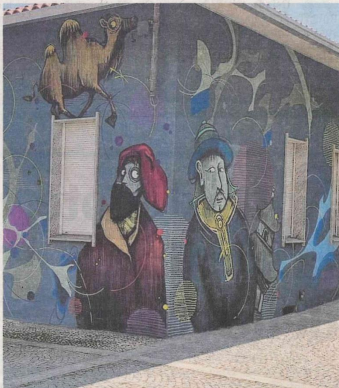
Il murale dedicato a Marco Polo