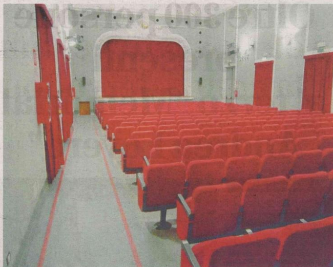
L'INTERNO DEL TEATRO ERIOS DI VIGLIANO

sonalmente molto legata e attenta. E' una struttura che risale ai primi anni del secolo scorso e si configura tra i teatri cosiddetti a sala piccola con una capienza che va da 100 a 499 posti dei quali 285 a sedere in platea e 52 in galleria. «Viene utilizzato in prevalenza per rappresentazioni teatrali, concerti e spettacoli musicali, performance di danza, ma anche per incontri pubblici e presentazioni. Negli anni abbiamo sempre cercato di fare in modo che la struttura potesse rispondere ai bisogni del viglianesi, investendo notevoli somme di denaro pubblico. Tutti questi interventi che stiamo portando avanti sono propedeutici all'affidamento del teatro a un