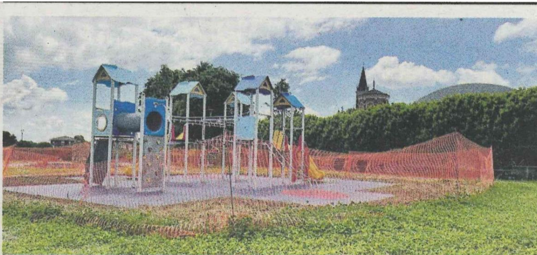
Il nuovo castello che si sta realizzando nell'area giochi di via Libertà a Vigliano