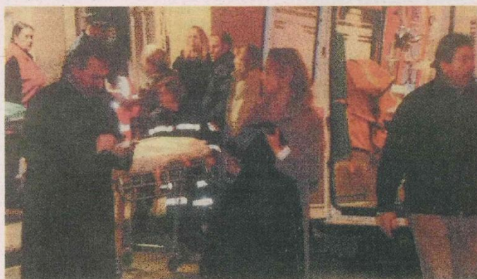
UN'IMMAGINE CHE RITRAE I PRIMI MINUTI DOPO LA TRAGEDIA ALLA PETTINA DI VIGLIANO DEL 2001