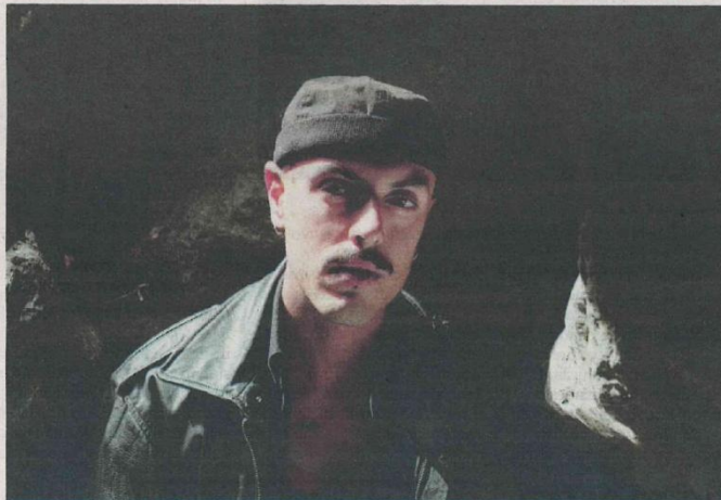
DAL VIVO Pugni, al secolo Lorenzo Pagni, sarà in concerto domani al Teatro Erios

"E.Ri.O.S. - Extra Rinomata Officina Spettacolo" si propone di promuovere le nuove produzioni artistiche, soprattutto musicali, e dar vita a una stagione culturale diversa, in grado di valorizzare spazi alternativi ai consueti luoghi della cultura piemontesi.