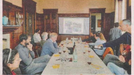
LA MASTER CLASS di viticoltura biologica alla settima edizione di In vigna veritas . A lato le "immersioni sonore"