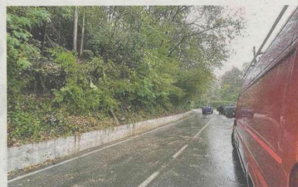
Il tratto della provinciale di Miagliano, ora riaperto

L'invito per i cittadini di Biella, Ronco e Zumaglia era così di un utilizzo parsimonioso dell'acqua per salvaguardare la risorsa disponibile. I tecnici del Cordar, affiancati dalle imprese di pronto intervento, hanno lavorato per risolvere il problema e prevenire ulteriori disagi.