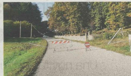
Il tratto tra Salussola e Zimone ancora chiuso