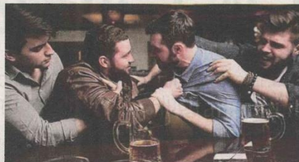
A scatenare la rissa è stato un 35enne ubriaco

Ma non c'è stato niente da fare, anzi. La situazione è presto degenerata e il 35enne ha afferrato una sedia scagliandola poi contro l'altro uomo. Il quale però è riuscito a scansarsi in tempo: sulla traiettoria c'era una cameriera del pub, una giovane di 28 anni, che è stata colpita alla testa.