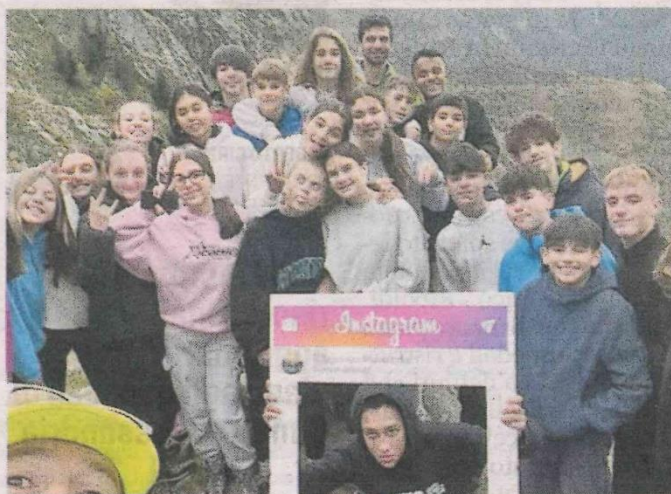
I ragazzi della terza C al rifugio Lago della Vecchia

P er i circa 90 ragazzi di terza media dell'istituto comprensivo di Vigliano (tre classi a Vigliano e una a Ronco) è arrivato l'atteso momento di trascorrere due giorni al rifugio Lago della Vecchia. Un'esperienza che fa parte del progetto «Mettiamo il naso fuori da scuola», giunto al terzo anno, e vivere la montagna aiuta i ragazzi a socializzare, ad essere solidali e a sentirsi più uniti come classe. Sembra strano in un territorio di montanari come il Biellese, ma la maggior parte di loro non ha mai vissuto l'esperienza di dormire in un rifugio e molti nemmeno quella di una passeggiata in montagna. «Tutti, però, tornano a casa entusiasti e soddisfatti di aver raggiunto a piedi il rifugio, di aver aiutato a cucinare, ad apparecchiare e sparecchiare il tavolo, a lavare i piatti - dice il preside Enrico Martinelli -. Lunedì e martedì, gli unici giorni di bel tempo della settimana appena trascorsa, è andata la III C e nei prossimi giorni toccherà alle altre 3 classi». Domani e martedì alla III A, mercoledì e giovedì alla III di Ronco e i prossimi lunedì e martedì alla III B (sperando nel bel tempo). «Partiamo con la spiegazione