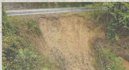
La frana sulla Valle Mosso-Valle San Nicolao

provinciale 215 Valle Mosso-Valle San Nicolao, nel comune di Valle San Nicolao, dove si era verificata una frana di sotto scarpa, in frazione Colongo. Riaperta anche la strada provinciale 510 a Miagliano, dove una pianta era caduta sui cavi della luce. I cavi si erano allentati e avevano fatto cadere alcuni mattoni nel perimetro di una ditta, facendo entrare all'interno dell'acqua piovana. I cavi sono stati staccati dal personale dell'Enel, giunto sul posto con i vigili del fuoco e i carabinieri di Andorno. Il tratto di strada è stato poi ripulito dal personale del Comune e riaperto. Sempre a Miagliano il sentiero della Madonna, recentemente ripristinato, è stato di nuovo interessato da fenomeni di smottamento del versante di monte e dal conte-