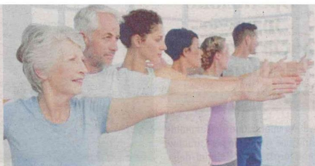
UN GRUPPO DI ANZIANI IMMORTALATI DURANTE L'ATTIVITÀ FISICA

Gli orari saranno i seguenti, al mattino lunedì e giovedì dalle 9 alle 10, pomeriggio, martedì e gio-