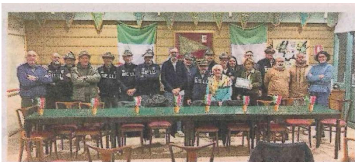
Il gruppo degli alpini di Vigliano Biellese

VIGLIANO, IL CONTRIBUTO CON VARIE INIZIATIVE