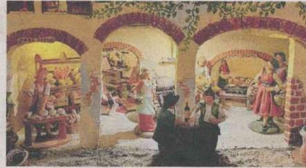
IL PRESEPE costruito e collocato nella chiesa di Santa Maria