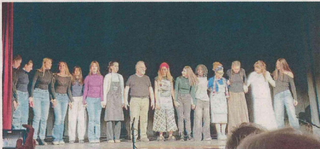
IL GRUPPO DEI RAGAZZI DEL LICEO QUINTINO SELLA IN SCENA AL TEATRO ERIOS

Fra satira e tragedia, 15 personaggi, quasi tutti femminili, hanno affrontato gli stereotipi, le gabbie emotive e i condizionamenti sociali di cui le donne sono