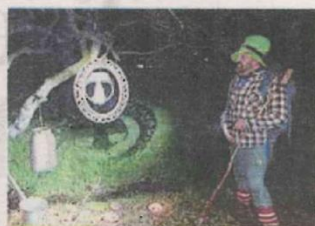
L'edizione dello scorso anno