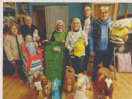
NELLA FOTOGRAFIA IN ALTO IL GRUPPO DEI VOLONTARI CHE HA RACCOLTO I GIOCATTOLI DA INVIARE AI BAMBINI DEL LIBANO, SOPRA UNA IMMAGINE DI REPERTORIO