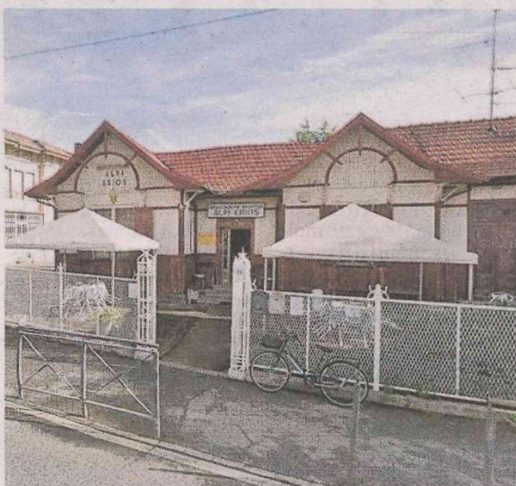
La sede del circolo Alpi Erios di Vigliano

Sarà un intervento delicato perché bisognerà organizzarlo in accordo con il gestore del circolo. «Quando avremo gli altri fondi a disposizio-