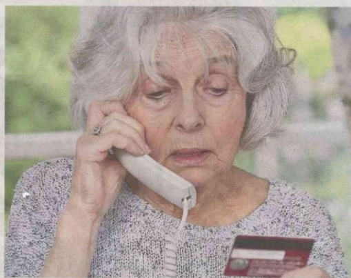
Sono sempre più raffinate le truffe ai danni di persone anziane

I militari ribadiscono che nessun rappresentante delle forze dell'ordine e nessun ente - che sia bancario o di carattere sanitario - chiederà mai soldi. Si invitano inoltre gli anziani e chiunque avesse dubbi, in caso di telefonate sospette, a contattare immediatamente le forze di polizia e/o segnalare l'episodio all'associazione dei Consumatori di corso Risorgimento a Biella (numero di telefono 015-401444), che si occupa in modo specifico di truffe e frodi.