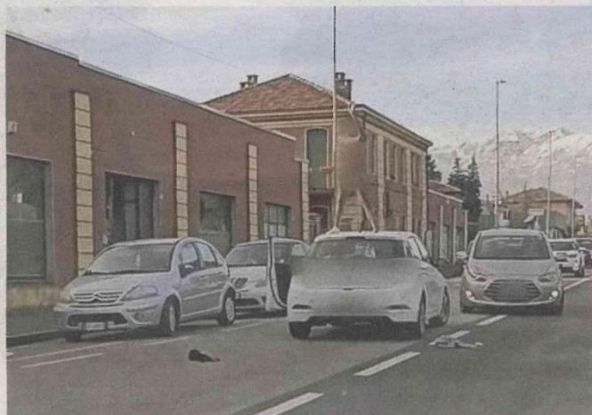
La donna in via Milano mentre balla nuda sul tetto dell'auto