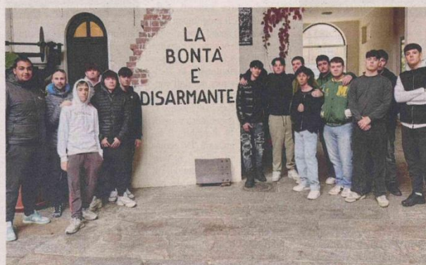
I RAGAZZI DELL'ISTITUTO CNOS-FAP IN VISITA ALL'ARSENALE DELLA PACE A TORINO

Mercoledì 10 dicembre 2025 La Provincia di Biella