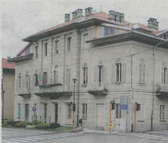
IL MUNICIPIO che ospita gli uffici comunali a Vigliano Biellese

Altri lavori, altro impegno di spesa. L'amministrazione comunale di Vigliano intende, inoltre, «eseguire degli interventi manutentivi straordinari atti a risolvere situazioni di degrado e ammaloramento di tratti di pia-